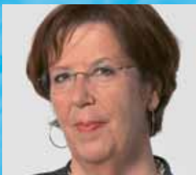
De voorzitter van de Vereniging van Nederlandse Gemeenten Annemarie Jorritsma-Lebbink