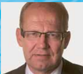
De staatssecretaris van Infrastructuur en Milieu Joop Atsma

A handwritten signature in black ink, appearing to be 'Joop Atsma'.